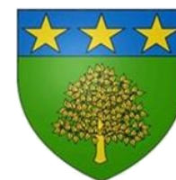
VILLE DE LA SALVÉTAT SAINT-GILLES

La constitution d'un CMJ relève de l'éducation à la citoyenneté , les enfants et les jeunes réaliseront des actions et projets en rapport avec la citoyenneté et utiles à la population Salvétaine.