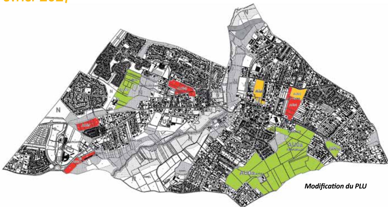
Modification du PLU