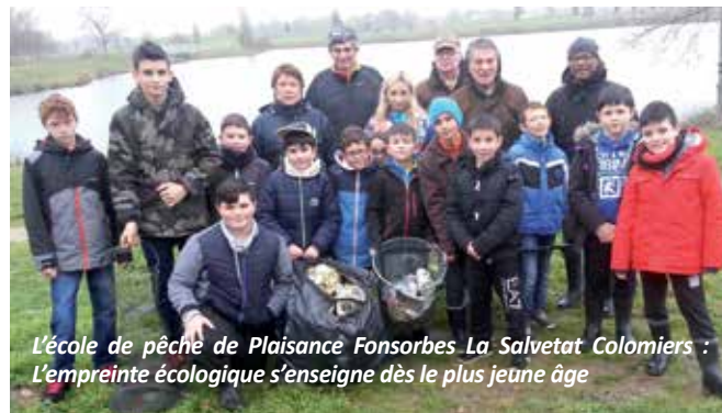
L'école de pêche de Plaisance Fonsorbes La Salvetat Colomiers : L'empreinte écologique s'enseigne dès le plus jeune âge

Carte journalière 15 € / Carte hebdomadaires 32 €